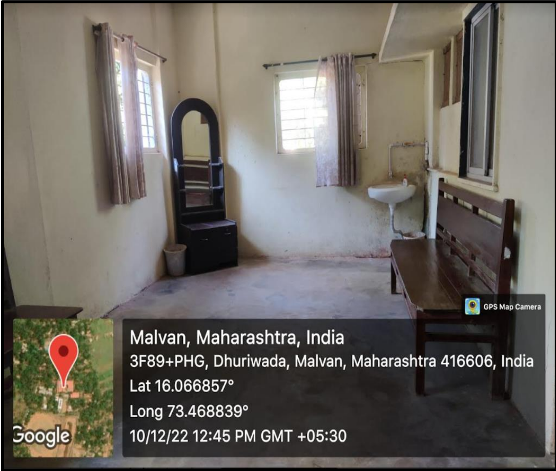
Specific Facility – Ladies Common Room