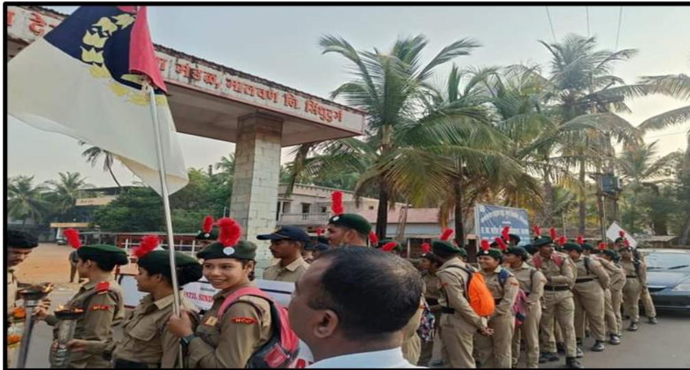
International Women's Day Rally "Sindhudurg fort to Bharatgad fort organized by NCC Department- 9/03/2023