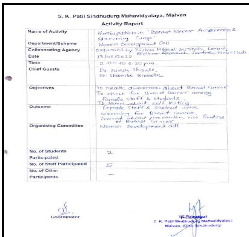
Activity Report of Breast Cancer Awareness & Screening Camp – 13/08/2022