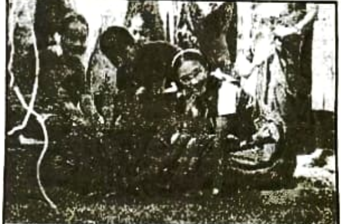
सिंधुदुर्ग महाविद्यालय येथे आयोजित झालेले छोटे पर्यावरण कसे? या कार्यक्रमाच्या निमित्ताने वृक्षारोपण करताना लहान मुले.