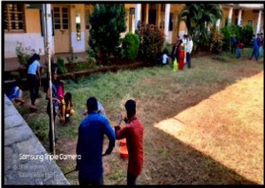
कॉलेज कॅम्पस स्वच्छता