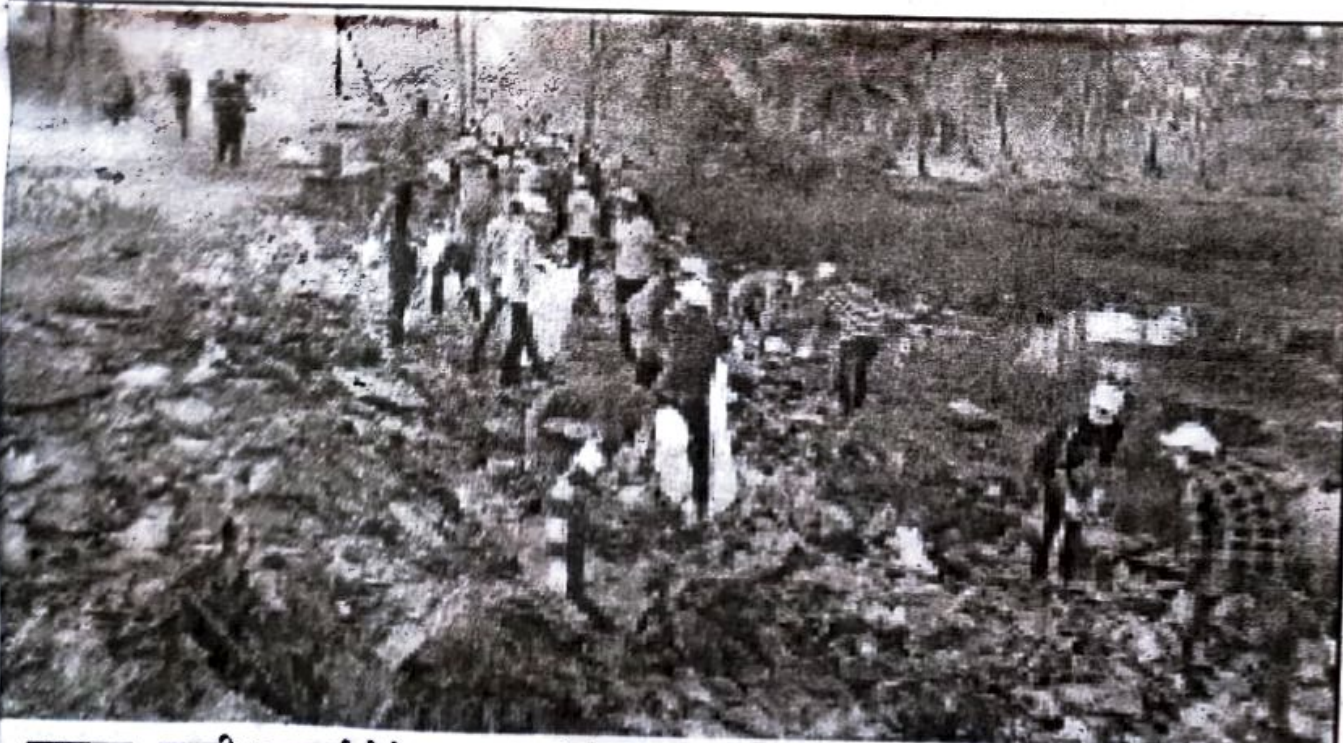
मालवण: सागरी महामार्ग येथे स्वच्छता मोहिम राबविताना सिंधुदुर्ग महाविद्यालयाच्या नेचर क्लबचे प्राध्यापक, व पर्यावरण प्रेमी नागरिक.