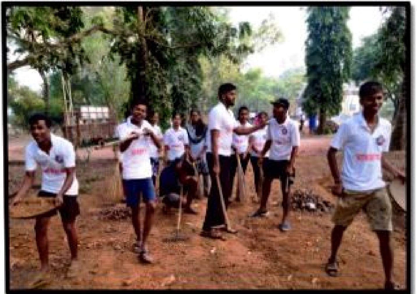
ग्रामपंचायत परिसर स्वच्छता