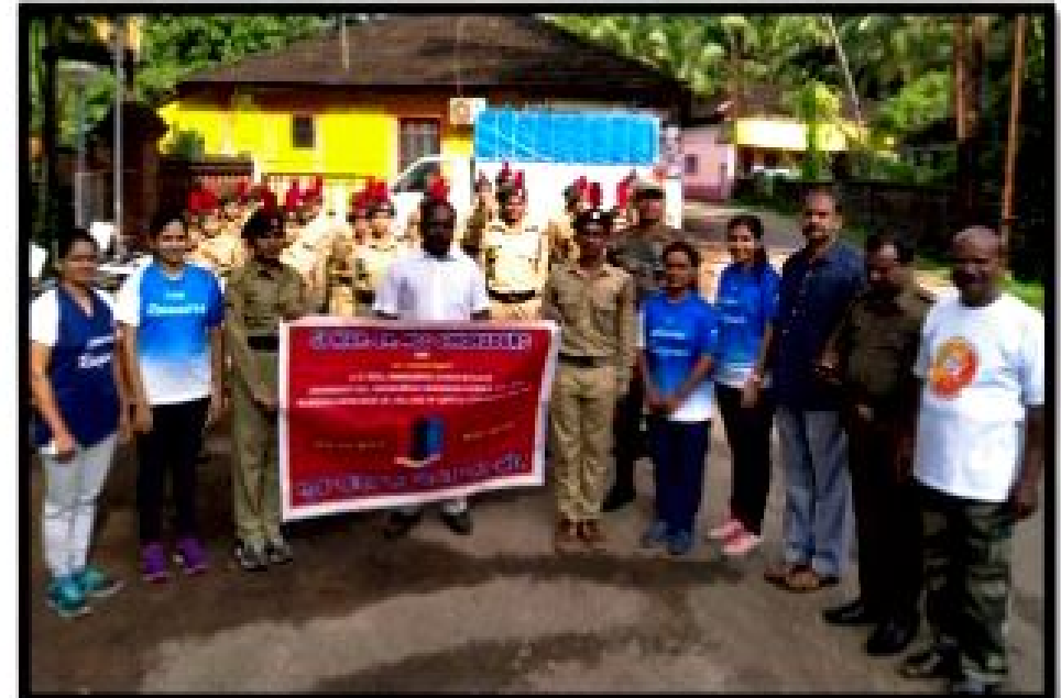
एक कदम स्वच्छता की ओर