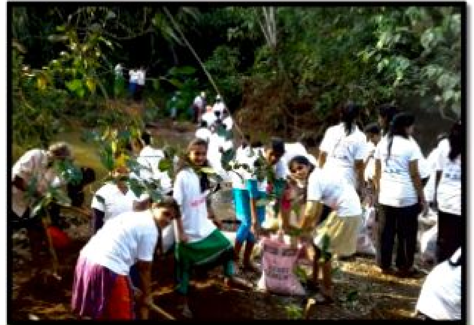
कांदळगाव कॅम्प स्वच्छता