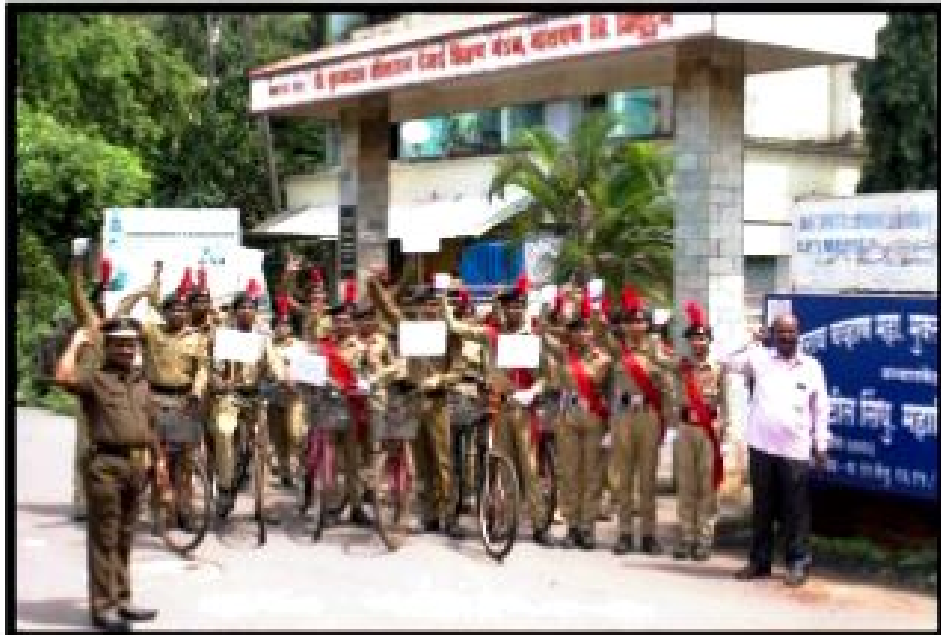
पर्यावरण रक्षण – सायकल रॅली