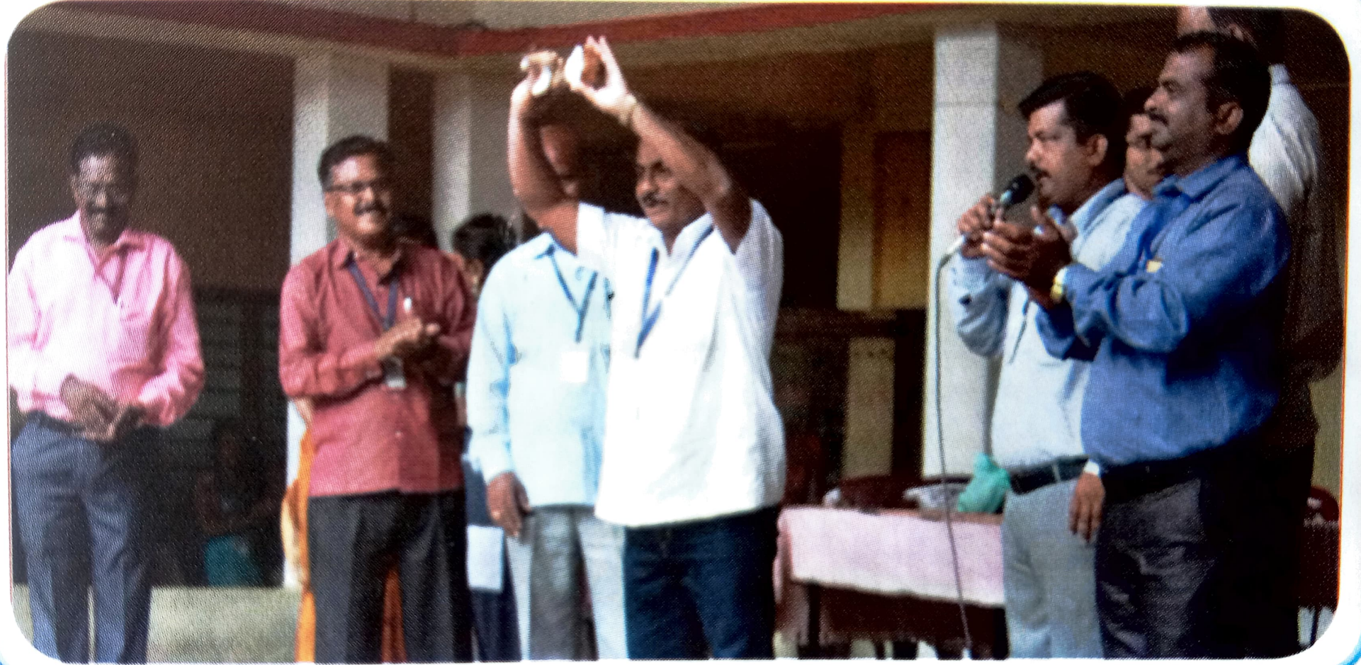
નારઝ લઢવિણે સ્પર્ધા ઉદ્ઘાટન સમારંભ