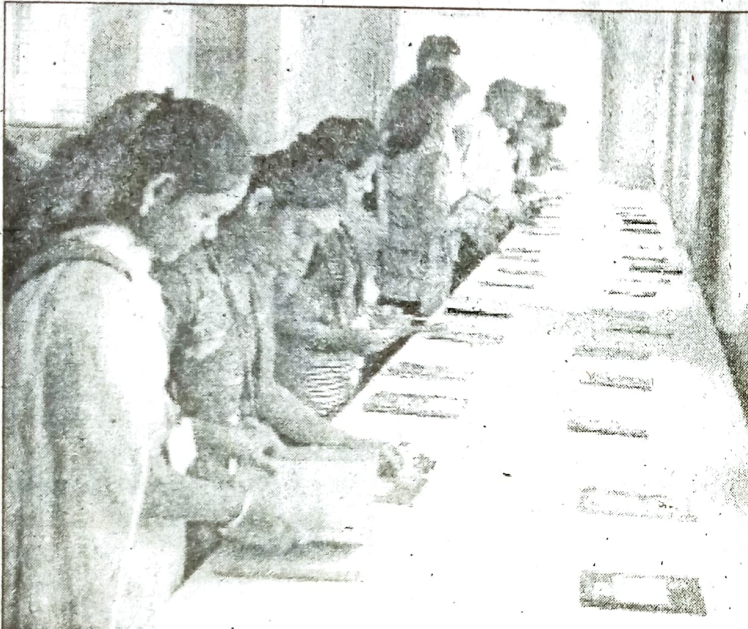
सिंधुदुर्ग महाविद्यालयात आयोजित ग्रंथप्रदर्शनास विद्यार्थी व प्राध्यापक यांनी भेट दिली.

दि. १/०२/१७ दे. सिंधुदुर्ग - रत्नागिरी टाडम्ब